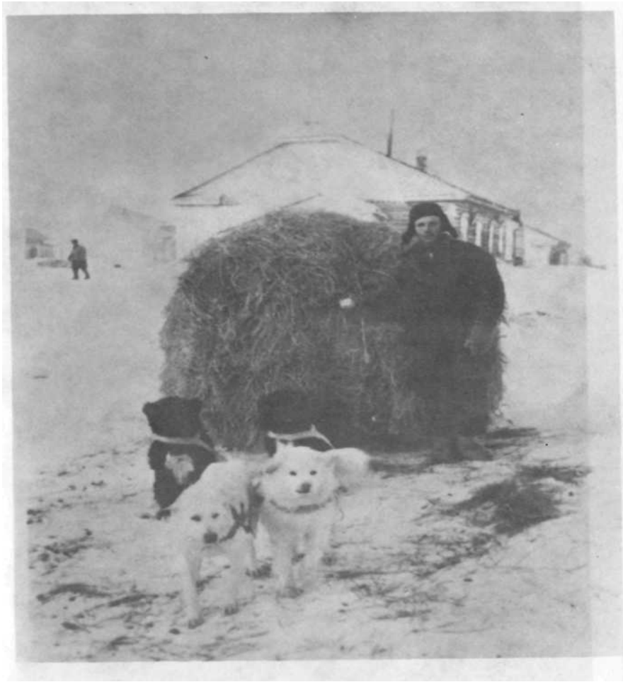
Toader lingă sania trasă de cîini. Siberia, 1956.