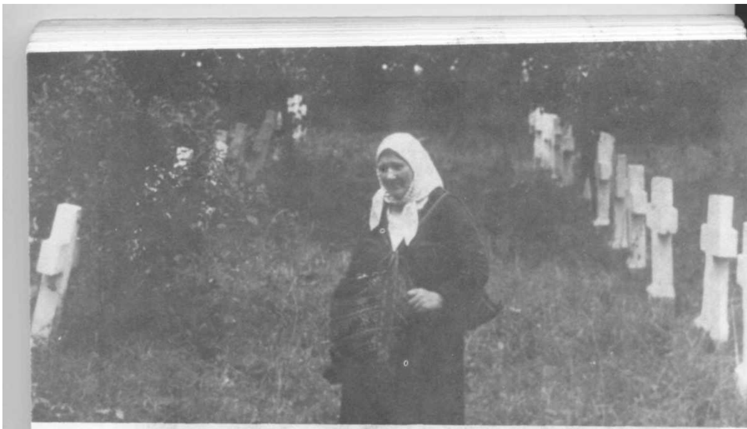
Cimitirul satului Mahala, 1941. Șirurile de cruci pomenesc pe cei ce au încercat să treacă frontiera spre România și au fost omoriți de grănicerii sovietici.