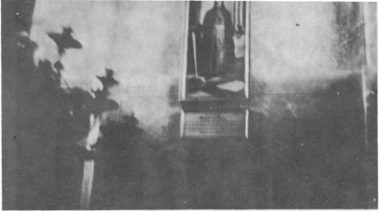
Icoana lui Ștefan cel Mare din biserica satului Mahala.