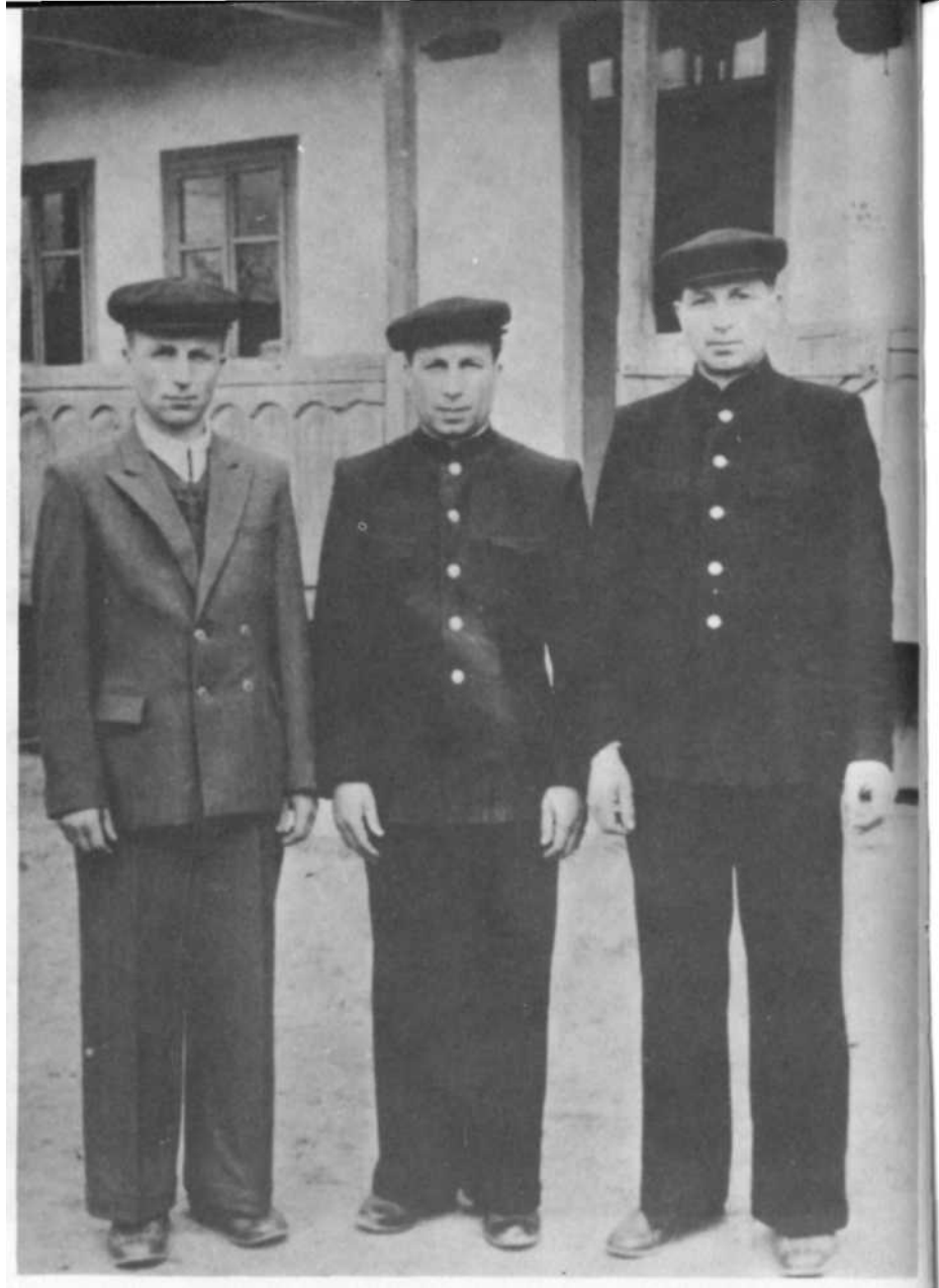
Cei trei frați reîntorși în satul românesc Mahala, în fața casei lor, după 20 de ani de surghiun în Siberia. Anul 1960.