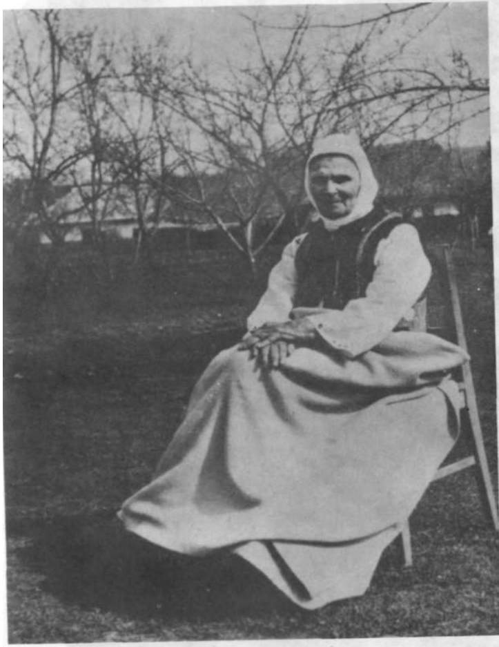
Mama Aniței, în 1940.