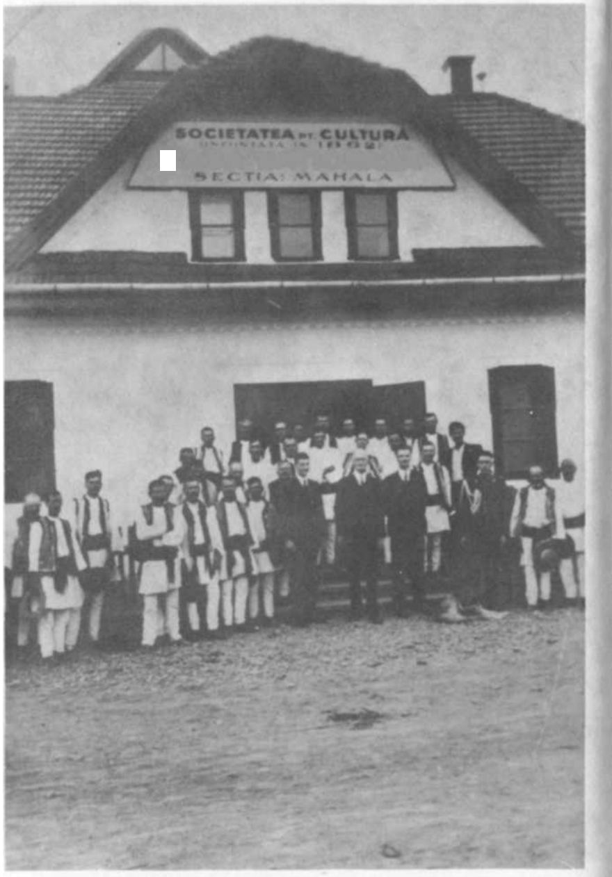
Casa Națională din Mahala, in 1937.